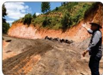
ESTRADA DA FAZENDA LEOGILDO