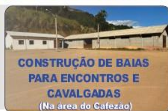
CONSTRUÇÃO DE BAIAS PARA ENCONTROS E CAVALGADAS (Na área do Cafezão)

Os recursos chegaram para a construção desse pavilhão, que é fundamental para abrigar os eventos do município e para diversas atividades.