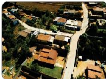
CALÇAMENTO DA VILA ZÉ LALAU (parte alta)