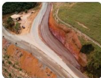
ENTRADA DO CÓRREGO GRANDE