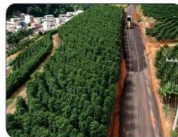
MORRO DA CESAN