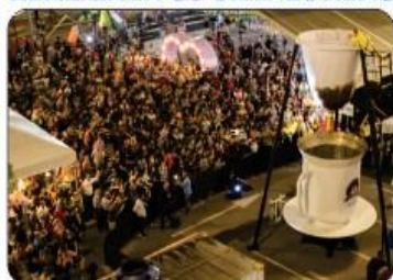
COAGEM EM ARACAJÚ