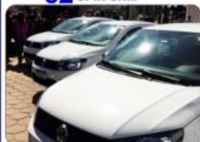
03 VOLKSWAGEN GOL 0KM