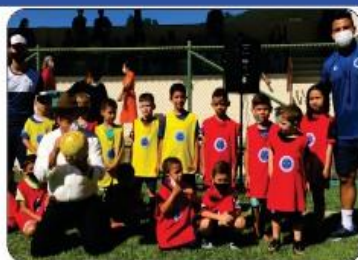
ESCOLINHA DO CRUZEIRO

VALORIZANDO A CULTURA DE BREJETUBA, FORAM REALIZADOS VÁRIOS EVENTOS