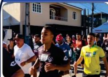
CORRIDA DE RUA