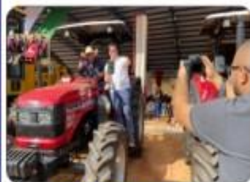
04 TRATORES SOLIS 75 CV YAMAR