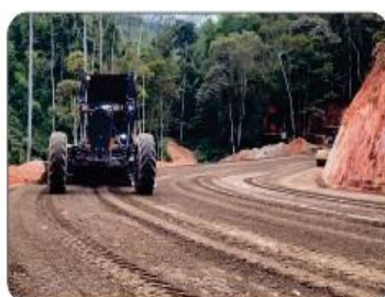
CÓRREGO DO MARAPÉ