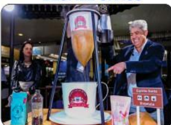
MINI COAGEM DO CAFÉ