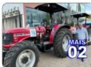
TOTALIZANDO 02 TRATORES