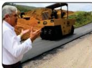
DURANTE O RECAPEAMENTO ASFÁLTICO