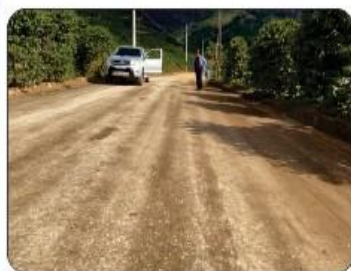
REVSOL PARA VILA NUNES (Brejaubinha)