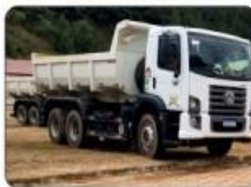
2º CAMINHÃO TRUCK