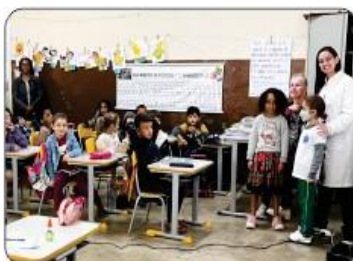
SAÚDE BUCAL NA ESCOLA