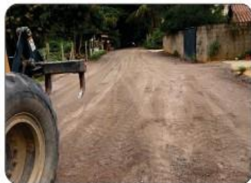
RUAS DA VILA MADALENA