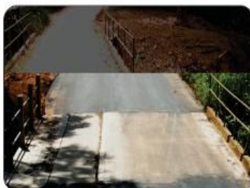
DUPLICAÇÃO DA SEGUNDA PONTE PARA BREJAUBINHA