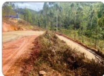
MORRO PRÓXIMO A PRF