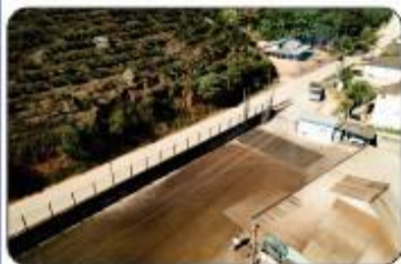
CALÇAMENTO DA VILA DO SALINO