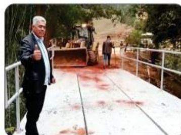
PONTE NO PATI I