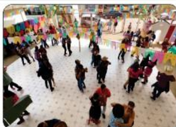
FORRÓ PARA A MELHOR IDADE