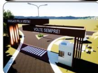
PORTAL NO TREVO DE BREJETUBA