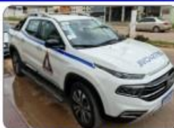
FIAT TORO 0KM