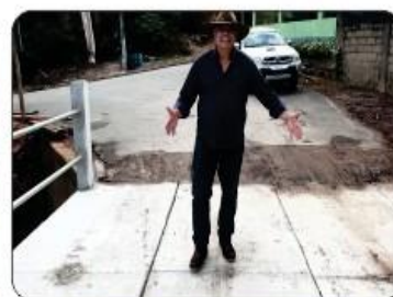
PONTE DE CONCRETO NO SERTÃOZINHO