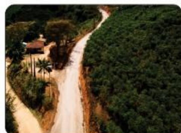
SERRA DOS CAROLAS