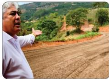
SERRA DO PATI