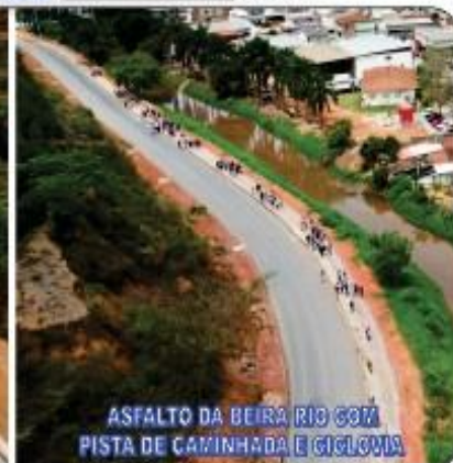
ASFALTO DA BEIRA RIO COM PISTA DE CAMINHADA E CICLOVIA