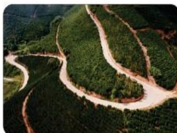
SERRA DA VILA RODEX