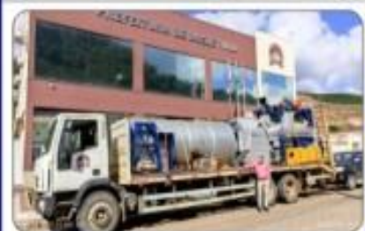
08 SECADORES DE CAFÉ