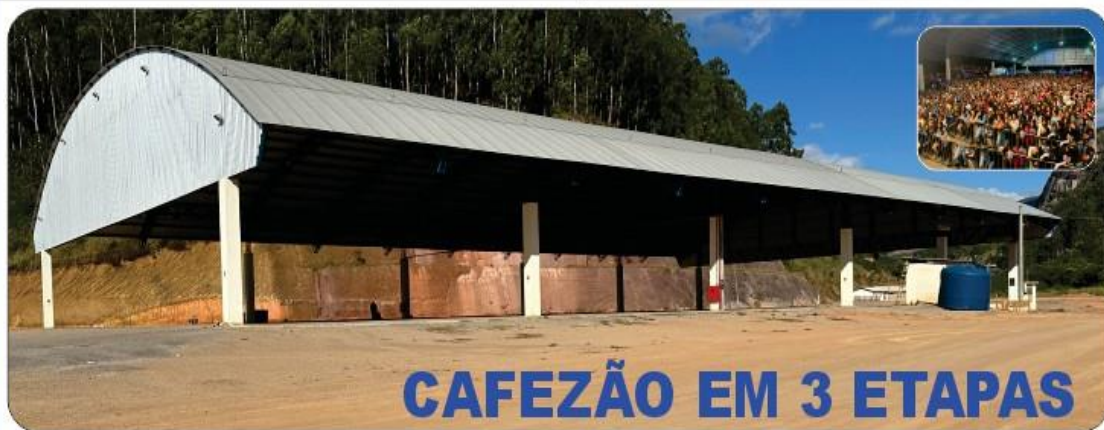
CAFEZÃO EM 3 ETAPAS

VALORIZANDO A CULTURA DE BREJETUBA, FORAM REALIZADOS VÁRIOS EVENTOS