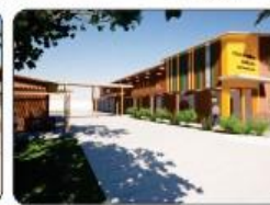
ESCOLA FAMÍLIA AGRÍCOLA