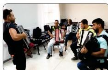
OFICINA DE SANFONA