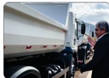
02 CAMINHÕES TOCO