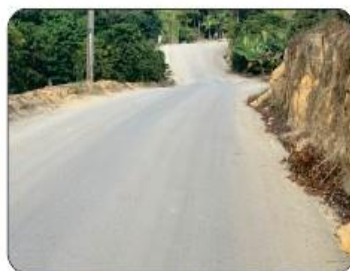
REVSOL NA ESTRADA DO RECANTO (Brejaubinha)