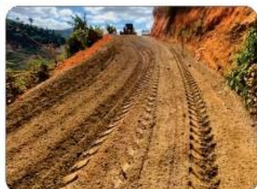
SERRA DO ADELMO