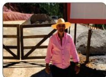
CENTRO DE REVSOL