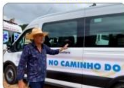
02 VAN TRANSIT 0KM