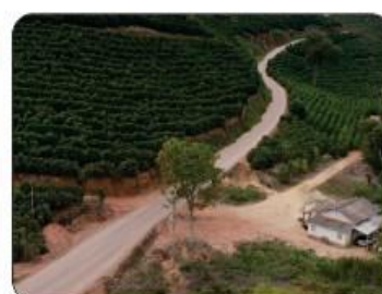
SERRA TRÊS DE MAIO CÓRREGO DO PAVÃO