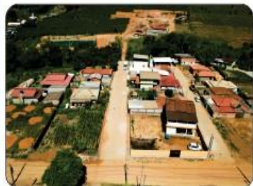
CALÇAMENTO DA VILA ZÉ LALAU (parte baixa)