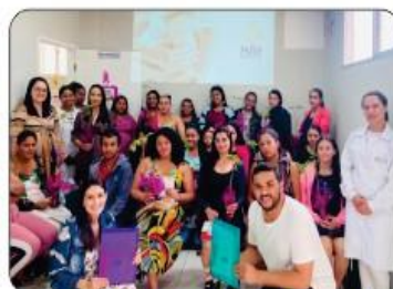
SALA DA MATERNIDADE