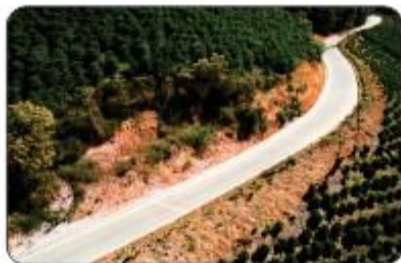
CALÇAMENTO DA SERRA DO SALINO