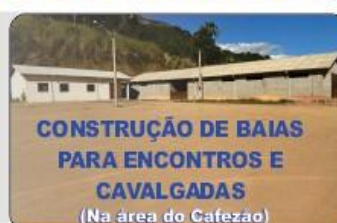
CONSTRUÇÃO DE BAIAS PARA ENCONTROS E CAVALGADAS (Na área do Cafezão)

Os recursos chegaram para a construção desse pavilhão, que é fundamental para abrigar os eventos do município e para diversas atividades.