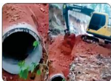
SERRA DA CORINA

Com o objetivo de garantir melhorias na infraestrutura da cidade e do campo, foram realizados inúmeros bueiros, além de manutenção das redes pluviais, para minimizar os problemas na época de chuva.