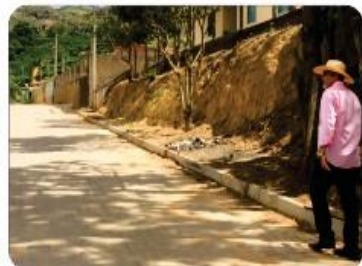
CALÇAMENTO EM SÃO DOMINGOS (Zé Otávio)