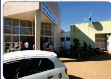
REFORMA DA UBS DE SÃO JORGE