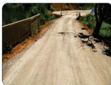
PONTE EM SÃO JORGE E ACABAMENTO EM REVSOL