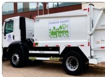
01 COMPACTADOR DE LIXO