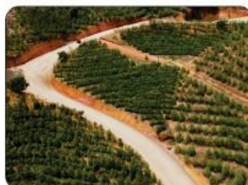
SERRA DOS CAMPORÊS