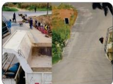
DUPLICAÇÃO DA PRIMEIRA PONTE PARA BREJAUBINHA