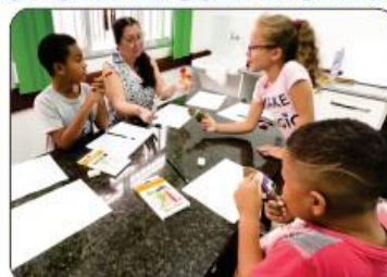
OFICINA DE ARTETERAPIA