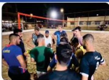
VÔLEI E FUTVÔLEI