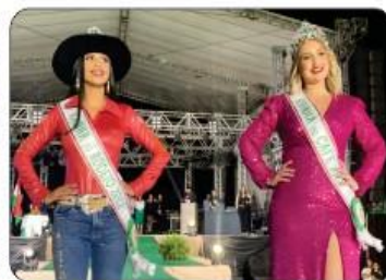
RAINHA DO CAFÉ E DO RODEIO