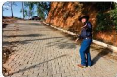
CALÇAMENTO DA SERRA DO ADELMO