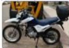
UMA MOTO BROS 160 0KM