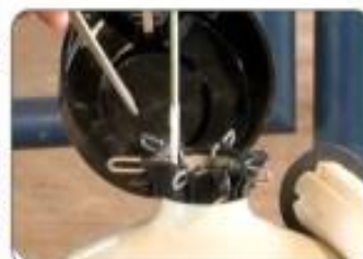
Incentivo na Pecuária Leiteira