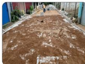
(em andamento) CALÇAMENTO DA VILA NUNES