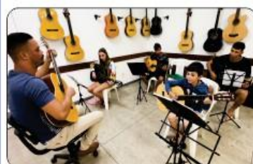
OFICINA DE VIOLÃO