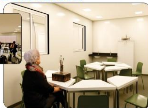
CENTRO DE CONVIVÊNCIA