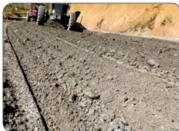
SERRA DO ALTO SILVEIRA