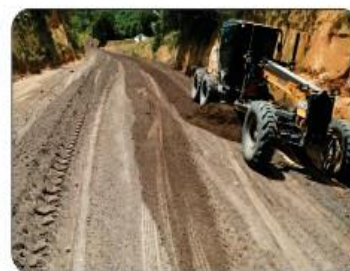
SERRA EM MONTE SANTO