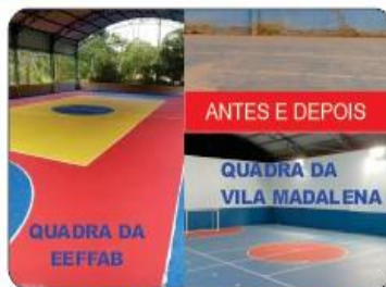
REFORMA DE QUADRAS