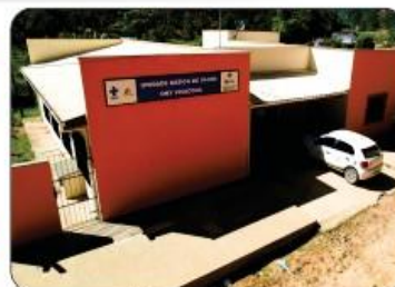
REFORMA DA UBS DE MARAPÉ