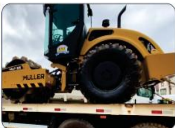
01 ROLO COMPACTADOR