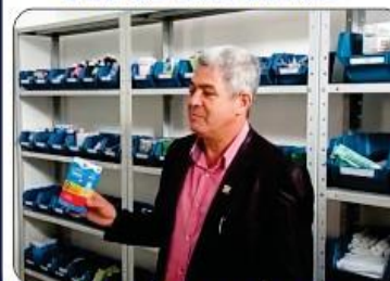
FARMÁCIA BÁSICA EM SÃO JORGE DESDE 2021