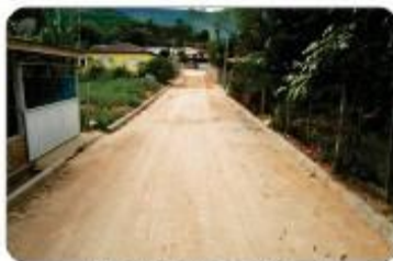
CALÇAMENTO DA VILA RODEX