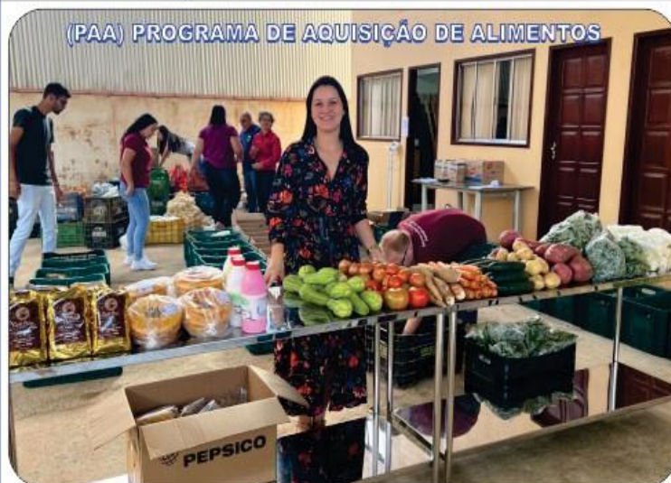
(PAA) PROGRAMA DE AQUISIÇÃO DE ALIMENTOS