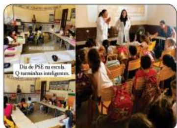
(PSE) PROGRAMA SAÚDE NA ESCOLA