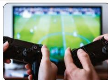
COMPETIÇÃO DE VIDEOGAME