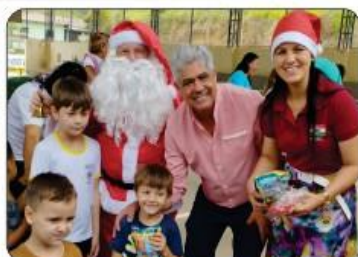
ENTREGA DE BRINQUEDOS