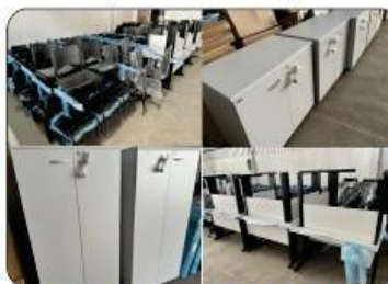
NOVOS MÓVEIS PARA AS UBSs DO MUNICÍPIO