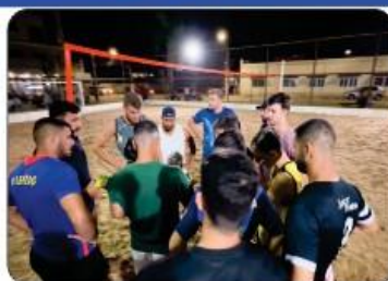
VÔLEI E FUTVÔLEI