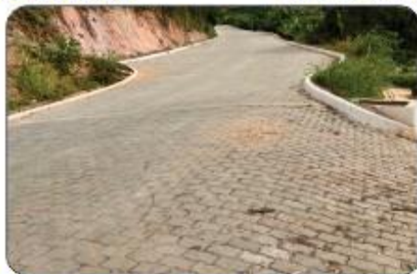
CALÇAMENTO DA SERRA DO ETELVINO

Em breve teremos o início das obras de Calçamento da Serra da Corina que está em fase final de aprovação dos Projetos Executivos. Uma série de trabalhos que vêm trazendo satisfação, esperança e reavivando os sonhos dos moradores com o objetivo de desenvolvimento para toda a cidade.