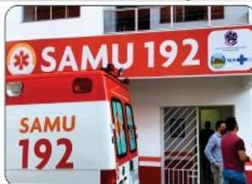
REFORMA DO SAMU