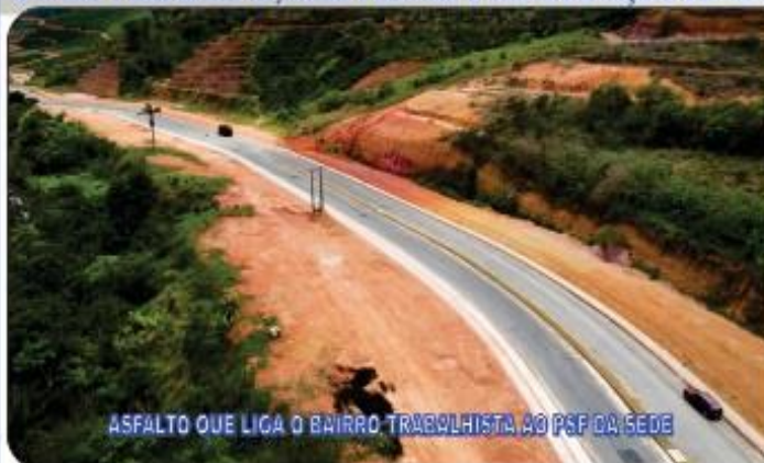
ASFALTO QUE LIGA O BAIRRO TRABALHISTA AO PSF DA SEDE