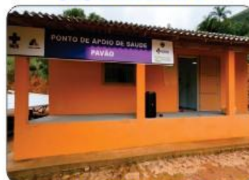
CONSTRUÇÃO DA UBS DO PAVÃO