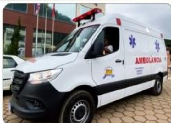
02 AMBULÂNCIAS OKM