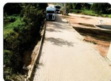
CALÇAMENTO DA VILA PASSOS