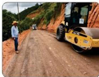
SERRA PARA SANTA RITA