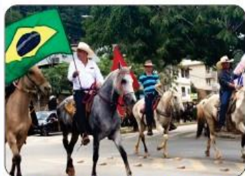
REALIZADA 03 CAVALGADAS