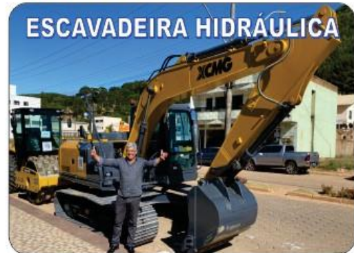
02 ESCAVADEIRA HIDRÁULICA