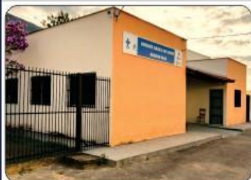
REFORMA DA UBS DE BREJAUBINHA