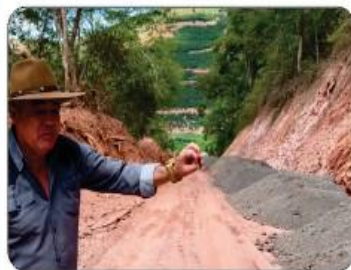
SERRA DO CÓRREGO GRANDE