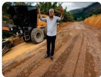
SERRA EM SANTA RITA