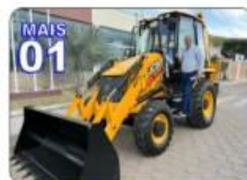
TOTALIZANDO 01 RETROSCAVADORAS

O EMPENHO DO PREFEITO JUNTAMENTE COM O GOVERNO DO ESTADO, MUDOU A REALIDADE DOS MORADORES DA ZONA RURAL.