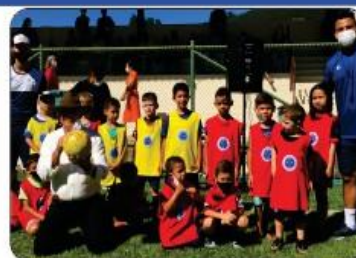
ESCOLINHA DO CRUZEIRO

VALORIZANDO A CULTURA DE BREJETUBA, FORAM REALIZADOS VÁRIOS EVENTOS