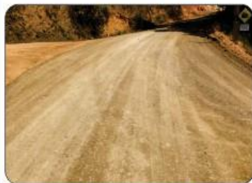
RANCHO DANTAS SERRA (NA SEDE)