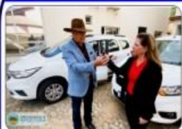
02 SPIN 0KM