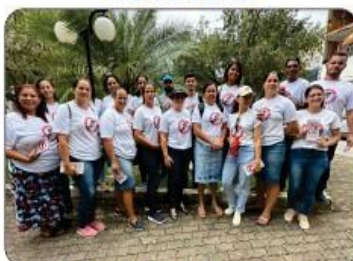
COMBATE A DENGUE

Temos notáveis melhorias na rede municipal de saúde, como a inserção de dois médicos no Pronto Atendimento diariamente, exames de Raio-X 12 horas todos os dias da semana, inclusive sábados, domingos e feriados. E mais, ampliação no atendimento da farmácia básica de 7h às 19h de segunda a sexta.