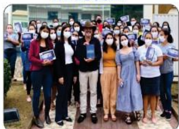
ENTREGA DE TABLETS PARA OS AGENTES DE SAÚDE