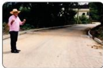
CALÇAMENTO DA VILA VARGEM ALTA