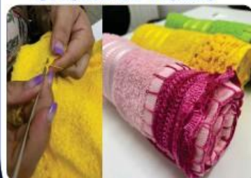
OFICINA DE CROCHÊ