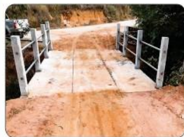
PONTE EM RANCHO DANTAS