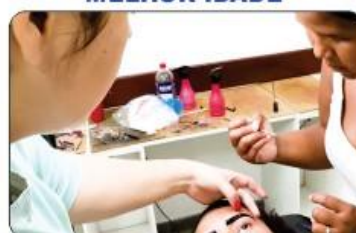
OFICINA DE SOBRANCELHA