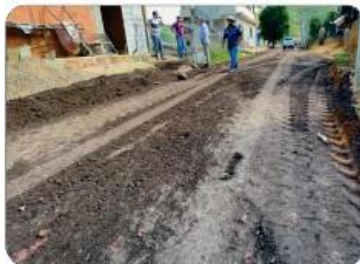
RUAS DE SÃO JORGE