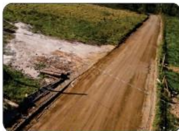
RANCHO DANTAS SERRA (NO ALTO)