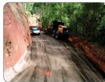
SERRA DO BELIZÁRIO