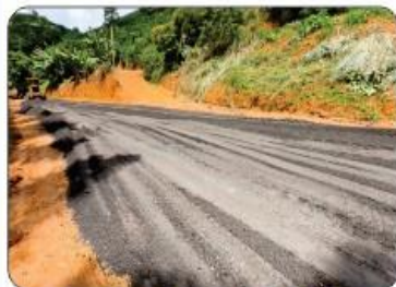
PONTO CRÍTICO DO CÓRREGO DOS VICENTES