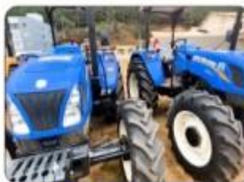
02 TRATORES NEW HOLLAND 75 CV