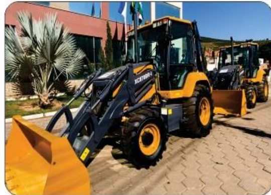
02 RETROESCAVADEIRA 2024