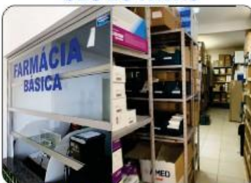
FARMÁCIA BÁSICA DA SEDE