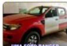
UMA FORD RANGER (Doado pelo Corpo de Bombeiros)