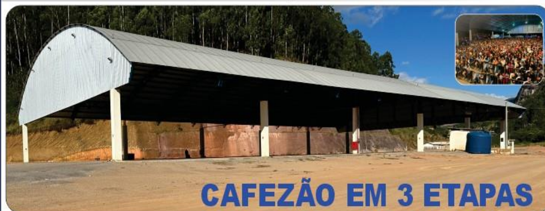
CAFEZÃO EM 3 ETAPAS

VALORIZANDO A CULTURA DE BREJETUBA, FORAM REALIZADOS VÁRIOS EVENTOS