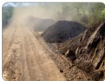
SERRA EM SÃO JORGE (Perto do campo)