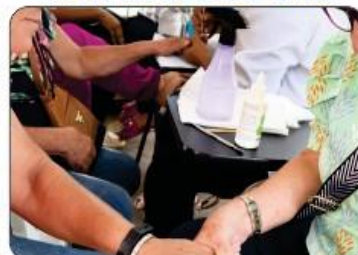
OFICINA DE MANICURE