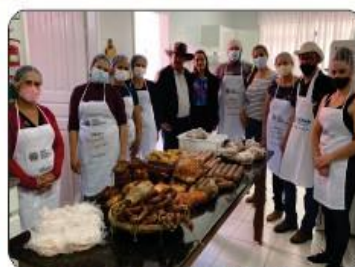
CURSO DE EMBUTIDOS