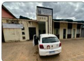
UBS FAZENDA LEOGILDO (Reforma em breve)