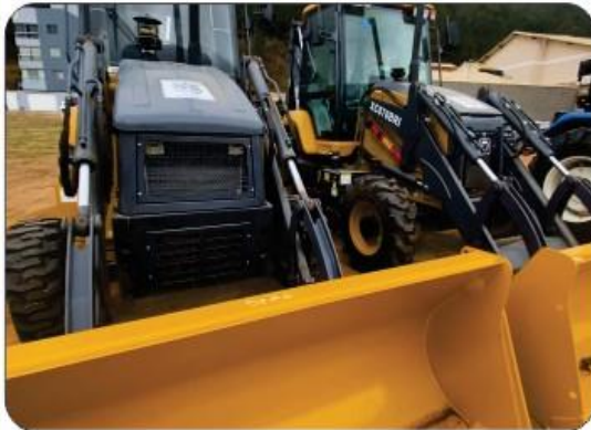
02 RETROESCAVADEIRA 2022