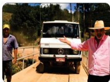
PONTE NO PATI II