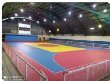
REFORMA DO GINÁSIO