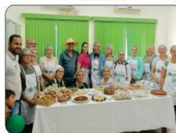
CURSO DE CAFÉS