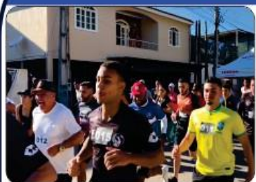
CORRIDA DE RUA