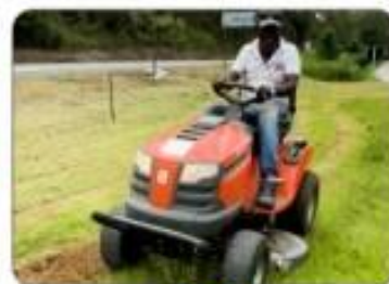
02 CORTADORES DE GRAMA