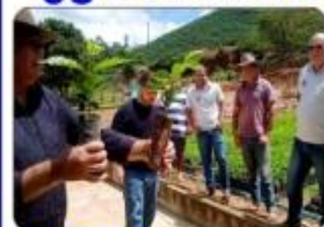
400.000 MUDAS DE CAFÉ Para pequenos produtores