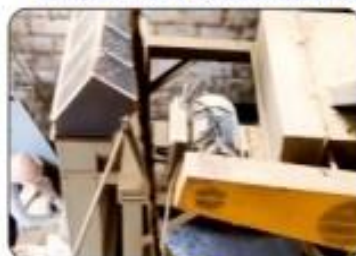
03 MÁQUINAS DE PILAR CAFÉ