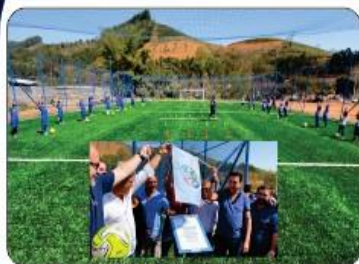
REFORMA DO CAMPO BOM DE BOLA DA SEDE