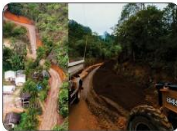
SERRA DOS MIRANDAS